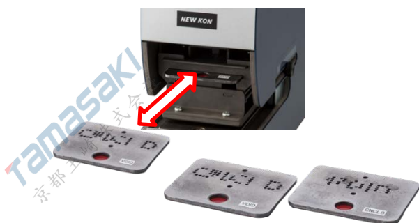
【キープレートの交換】